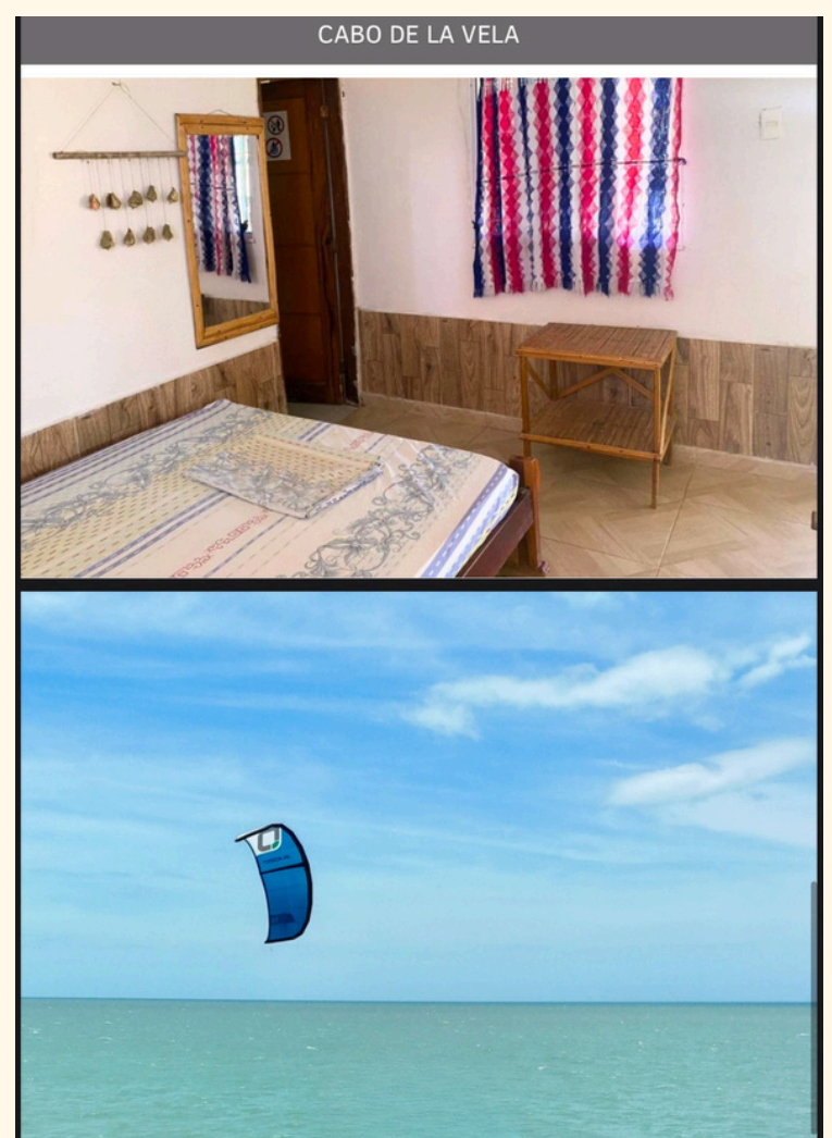
CABO DE LA VELA